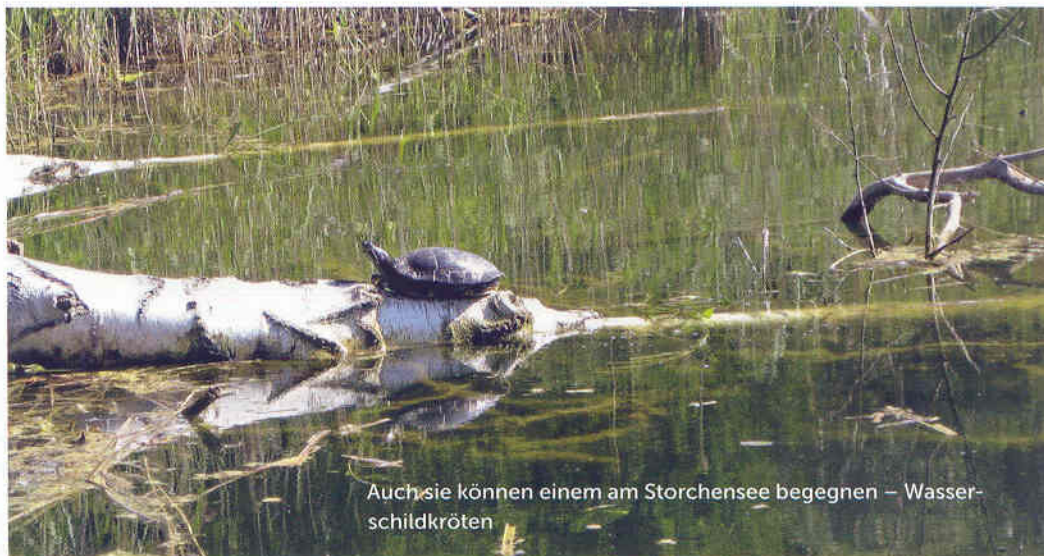
Auch sie können einem am Storchensee begegnen – Wasserschildkröten

Sind mal keine Fische im Uferbereich zu sehen, montiere ich einen Bissanzeiger und verlängere das Vorfach an einigen Stellen sogar bis auf fünf Meter Länge, ich werfe das Ganze so weit es geht aus, warte, bis die Fliege abgesunken ist, dann ziehe ich sie wieder langsam mit kurzen Schnurzügen, unterbrochen von kleinen Pausen, ein. Eine andere sehr wirksame Methode ist das Verwenden einer Sink-