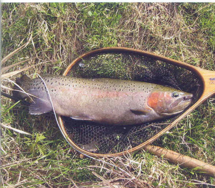
Eine stramme Regenbogenforelle aus dem Storchensee

Weitere Informationen: Bernd Geier F.F.F. Certified Master Fly Casting Instructor info@fliegenfischerschule.net www.fliegenfischerschule.net Tel.: 06103-3033578 (Privat), Tel.: 06151-16-3330 (Büro).