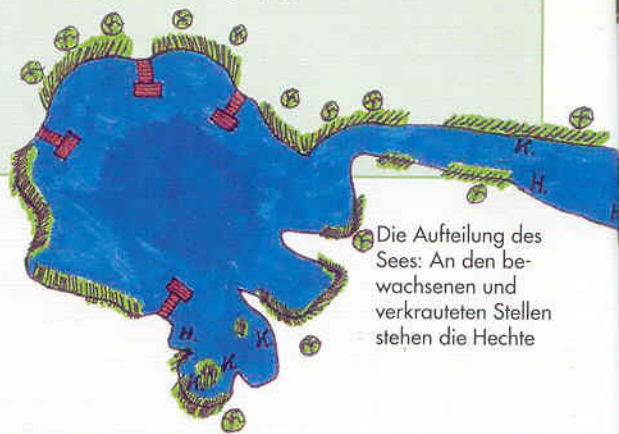
Die Aufteilung des Sees: An den bewachsenen und verkrauteten Stellen stehen die Hechte

http://www.app-seltz.eu Seite über den Storchensee, von Claude Behr, in Deutsch, Englisch und Französisch: http://pagesperso-orange.fr/claude.behr/fliegenfischen/wilkommen.htm