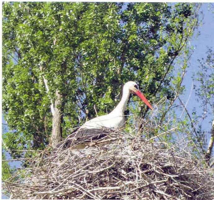
Meister Adebar hat dem Storchensee seinen Namen verliehen

Fliegenfischereinsteiger müssen hier im übrigen keine Angst haben, denn man muss hier nicht unbedingt weit werfen können, meistens sieht man ganz nahe am Ufer Forellen auf Nahrungssuche, die dann, wenn man sich vorsichtig bewegt, auch zu fangen sind. In beiden Seen ist nur das Fliegenfischen ohne oder mit angebrücktem Widerhaken erlaubt, beachten Sie bitte auch die Aushänge am See oder im Schaukasten in der Nähe der Glascontainer, in dem immer die aktuellen Vorschriften zur Fischerei zu finden sind!