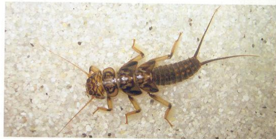
So sieht das Vorbild der B.G. Steinfliegennympe aus: eine Steinfliegenlarve vor dem Schlupf.